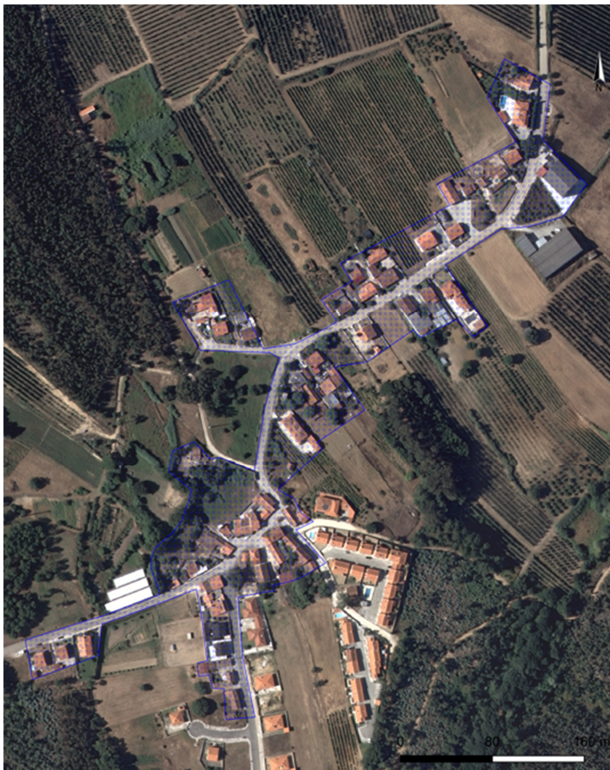
Fig. 4 – (Re)delimitação da Área de Regeneração Urbana