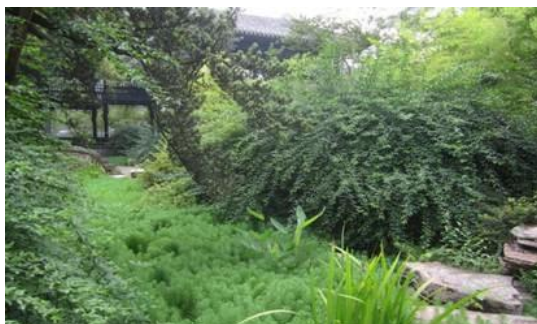
Figura 18 – Margens de curso de água

Esta legislação é inserida no âmbito da ação de sensibilização da defesa da floresta contra incêndios, por se verificar que em zonas adjacentes a edificações, as faixas de gestão de combustível coincidem com as margens dos cursos de água, havendo necessidade de apurar responsabilidades no âmbito deste diploma para a execução das intervenções nessas áreas.