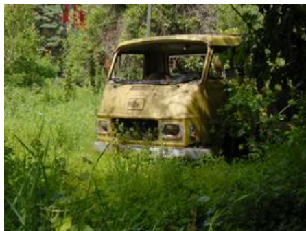
Figura 15 – Veículo em fim de vida

Veículo em fim de vida (VfV): É um veículo que constitui um resíduo de acordo com a definição do Decreto-Lei n.º 178/2006, de 5 de setembro, ou seja, é qualquer substância ou objeto de que o detentor se desfaz ou tem a intenção ou a obrigação de se desfazer.