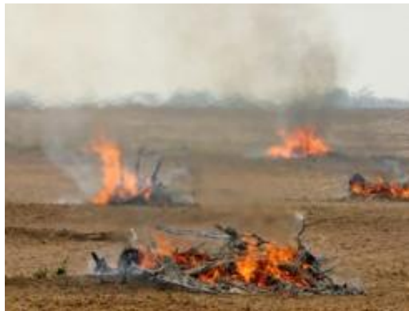
Figura 7 – Queima de sobrantes cortados e amontoados