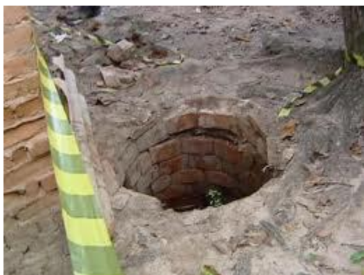
Figura 20 – Poço sem cobertura ou resguardo eficaz

A inclusão desta legislação na ação de sensibilização da defesa da floresta contra incêndios, surge com o objetivo de durante a fiscalização no âmbito do DL nº124/2006, sinalizar todas as irregularidades no solo para que os responsáveis procedam à sua regularização, impedindo a ocorrência de acidentes durante o combate aos incêndios florestais e a proteção da população e animais.