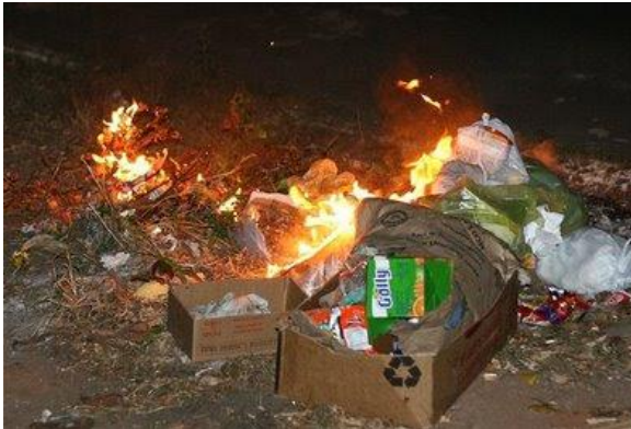
Figura 11 – Queima proibida - resíduos domésticos

Biomassa agrícola: a matéria vegetal proveniente da atividade agrícola, nomeadamente de podas de formações arbóreo-arbustivas, bem como material similar proveniente da manutenção de jardins.