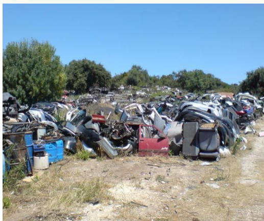
Figura 9 – Deposição irregular de resíduos industriais

A inclusão deste decreto-lei na ação de sensibilização, prende-se com a necessidade de esclarecer de forma simples e resumida a importância da gestão dos resíduos na defesa da floresta contra incêndios, alertando para os perigos que podem provocar os resíduos existentes em zonas florestais e rurais.