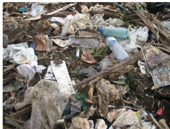
Figura 10 – Abandono de resíduos domésticos

A deposição de resíduos em áreas florestais, além de prejudicar o ambiente, representa uma ameaça porque: