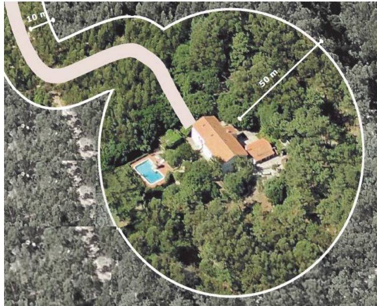
Figura 1 – Faixa de gestão de combustível – Casas isoladas