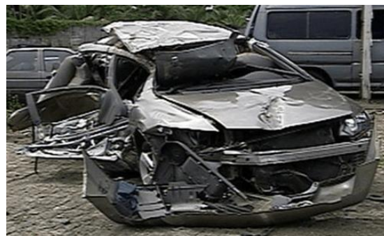
Figura 16 – Veículo inutilizado

Veículo inutilizado: considera-se inutilizado o veículo que tenha sofrido danos que impossibilitem definitivamente a sua circulação ou afetem gravemente as suas condições de segurança e o proprietário não tenha intenção de o reparar ou que tenha reprovado em inspeção extraordinária.