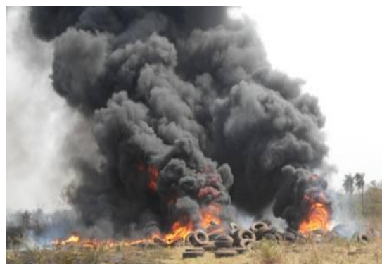
Figura 14 – Queima de pneus a céu aberto