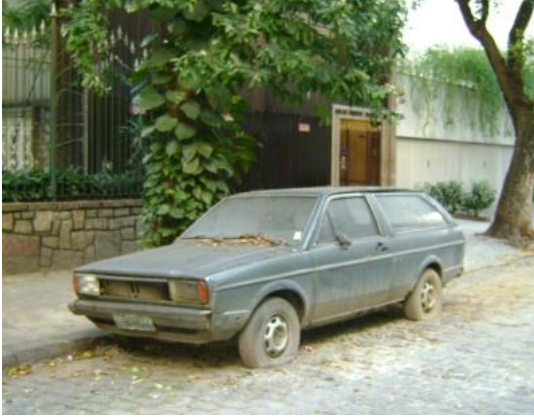
Figura 17 – Veículo abandonado

Veículos abandonados: consideram-se abandonados os veículos que apresentem sinais exteriores evidentes de abandono, de inutilização ou de impossibilidade de se deslocarem com segurança pelos seus próprios meios ou veículos sem chapa de matrícula ou com chapa que não permita a correta leitura da matrícula, que se encontrem em estacionamento indevido ou abusivo na via pública, no âmbito da legislação rodoviária.