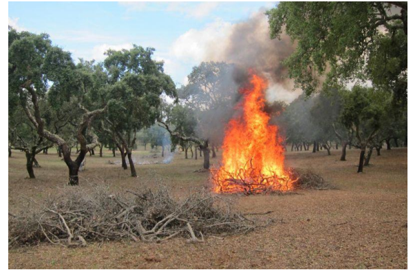
Figura 12 – Queima admitida – biomassa agrícola