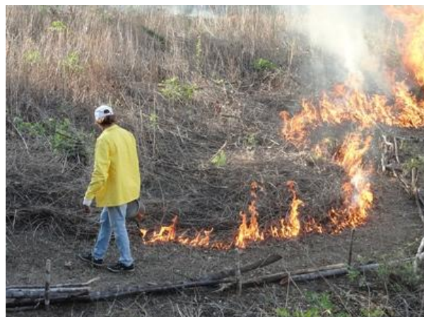
Figura 8 – Queimada executada por técnico credenciado