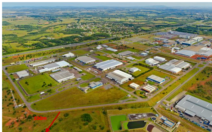
Figura 3 – Faixa de gestão de combustível – Parques e polígonos industriais

Faixa de Gestão de combustível nos parques de campismo, nas infraestruturas e equipamentos florestais de recreio, nos parques e polígonos industriais, nas plataformas de logística e nos aterros sanitários inseridos ou confinantes com espaços florestais