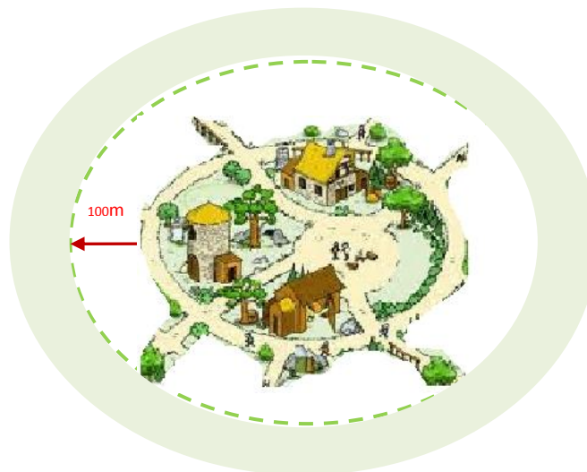
Figura 2 – Faixa de gestão de combustível – Aglomerados populacionais