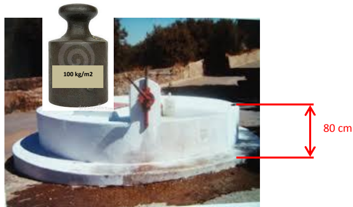
Figura 22 – Poço com cobertura e resguardo eficaz

Deverá possibilitar se tapada com tampa ou cancela que dê a devida proteção e só permanecerá aberta pelo tempo estritamente indispensável.