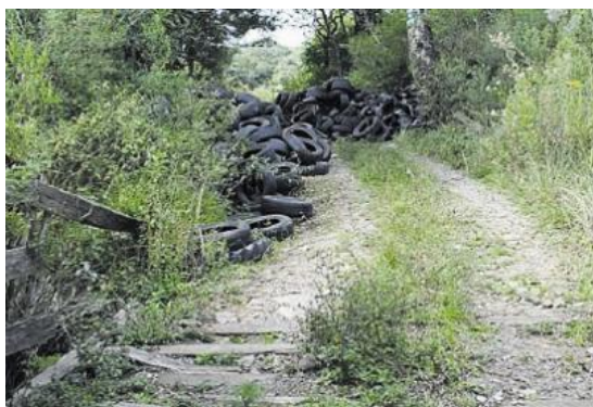
Figura 13 – Abandono de pneus

Fora do período crítico, com o índice de risco temporal de incêndio inferior a muito elevado, sendo permitido a queima de sobranes, é frequente detetarem-se colunas de fumo densas e escuras que denunciam a utilização de pneus na combustão, levando ao descontrolo da queima, dando origem na maior parte das vezes a incêndios florestais.