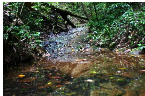
Figura 19 – Leito de curso de água