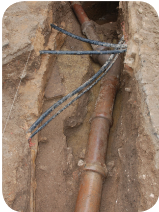
Perspectiva do troço intermédio do cano identificado na Travessa de Nossa Senhora do Rosário