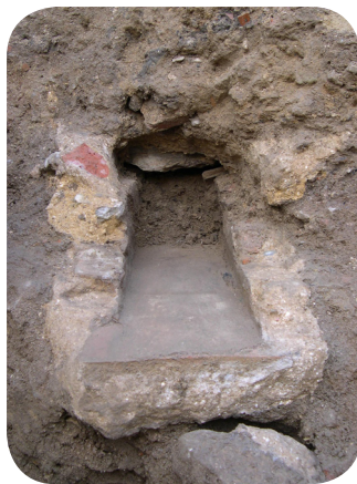
Aspecto do cano existente na Rua Josefa de Óbidos

Na Rua Josefa de Óbidos, os trabalhos de acompanhamento possibilitaram a identificação de um cano para a drenagem de águas pluviais e residuais. Corresponde a um pequeno cano em alvenaria ordinária, de secção tendencialmente rectangular, com o fundo revestido a tijoleira. Sofreu uma reparação, onde se reaproveitou fragmentos de tijolo. Em virtude da utilização, o cano apresenta um depósito calcário, com aproximadamente 5 mm de espessura. Segundo uma acta de vereação existente no Arquivo Histórico do Município, o concurso para a construção das calçadas da Rua Direita foi lançado no ano de 1873; este concurso incluiu também o encanamento das águas e a remoção dos antigos piais. Por conseguinte, e mesmo considerando que a vala de fundação corta depósitos datáveis do séc. XIX, atribuímos a construção do cano ao séc. XIX.