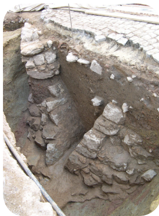
Vista do canal encontrado na Rua Dr. Luís Octávio de Amorim Garcia

Em paralelo, os trabalhos de acompanhamento possibilitaram a identificação de um troço de canal em alvenaria ordinária para a drenagem de águas. O canal revela uma secção trapezoidal invertida, com paredes fortemente inclinadas e fundo bastante estreito; não deveria apresentar cobertura. Desaparece sob um edifício de habitação, que delimita a Rua Dr. Luís Octávio de Amorim Garcia e a Rua D. João de Ornelas junto à Estalagem do Convento. Como a escavação do enchimento proporcionou materiais datá-