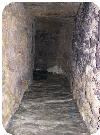
Perspectiva do cano principal existente na Rua D. João de Ornelas

Do acompanhamento arqueológico na Rua D. João de Ornelas resultou igualmente a detecção de três troços de canos para o escoamento de águas. O cano principal evidencia uma estrutura em alvenaria ordinária, de secção rectangular, com cobertura e fundo em lajes; reutiliza fragmentos de tijolo e de telha. Desaparece sob o edifício do Hotel Real d'Óbidos na direcção sul e sob o largo da Igreja de Nossa Senhora de Monserrate na direcção norte, segue pela encosta até ao Rio Arnóia, permanecendo um troço a descoberto. Este cano foi construído possivelmente nos sécs. XVIII ou XIX, por causa das relações de posterioridade com as estruturas e os depósitos envolventes. Os canos secundários mostram estruturas em alvenaria ordinária, de secção trapezoidal invertida ou rectangular, tendo cobertura em lajes, paredes revestidas com argamassa e fundo em pedras irregulares. Propomos uma fundação contemporânea, devido ao tipo de estrutura e às relações estratigráficas. Refira-se que estes canos continuam em funcionamento.